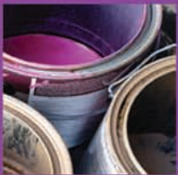
PINTURA Y SOLVENTES